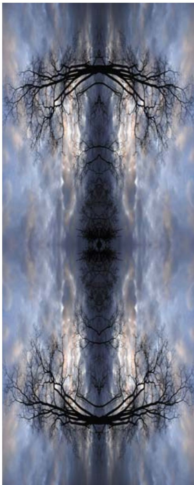
12 Kvadrál přírodní Jiřího Hellera

noramatické fotografie. Jak je pořizujete, na jaký přístroj? Zejména klasickým panoramatickým aparátlem Noblex Pro 150 s pohyblivou šterbinou, formát 6 × 12 cm, mnohé panoramatické snímky již vznikají skládáním fotografií z digitálního Nikonu.